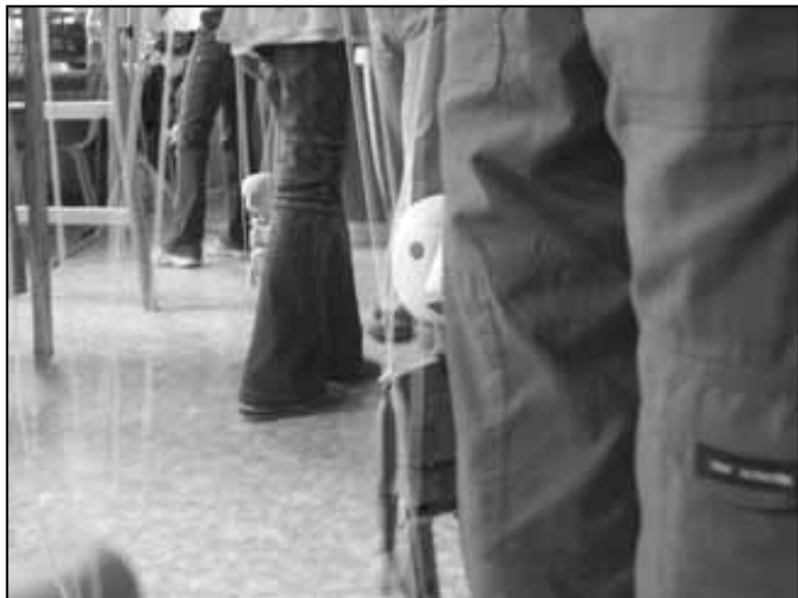
Seminář áčko. Kuk.

náramek moc, začíná modrat. My jsme to vyřešili, máme na to grif.“