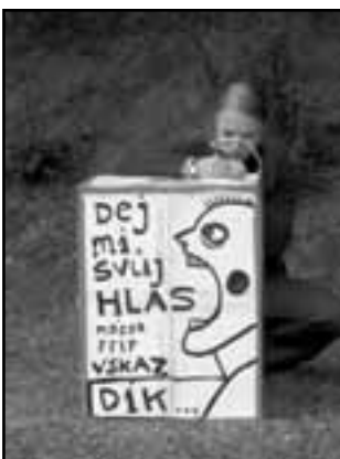
druhá bedna - za vodou