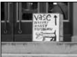
jedna bedna - u divadla

Škoda jen, že letos není ples. V Modré Hvězdě se plesalo skvěle. Třeba příště.