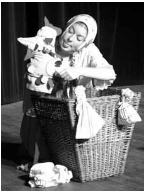
D ZUŠ Děčín

Herci, kteří nám chtějí vyprávět tento příběh? Domýšlíme si. Některé pasáže jsou možná až příliš rozkouskovány mezi jednotlivé interprety, že divák-posluchač ztrácí smysl sdělení. A neustále se valí další a další smršť slov a deklamace. S bílými totemickými loutkami-soškami postav příběhu herci manipulují a dotvářejí jejich gesta každý s jinou intenzitou. Někdo používá rukou více, jiný vůbec, pouze za loutkou promlouvá. Inscenaci chybí dějovost a dynamika. Zdlouhavé příchody a odchody herců z nepojmenovaného prostoru, kdy např. dva hrají a ostatní stojí zády k publiku a čekají pouze na svůj výstup, retarduje děj. Jak vlastně funguje chór v této inscenaci, když najednou zmizí v prostoru za...? Škoda nevyužití nabízené scénografie v podobě několika bílých krabic. Ocitáme se v různých prostředích a krabice jsou stále seskládaný stejným způsobem. Pouze při prostorovém přesunu na Krétu je dodáno několikero pruhů modré látky symbolizující moře. Napsané zakončím opět otázkou, kterých se v mé hlavě