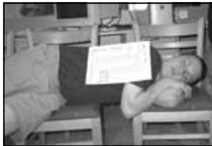
práce s knihou