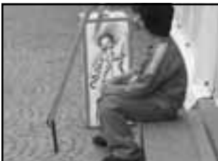
třetí bedna - před stanem