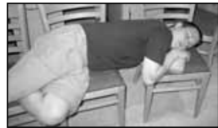
práce na knize